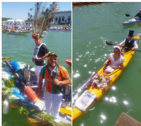
Un po' di sano folklore: l'uomo pavone e la coppia di sposi