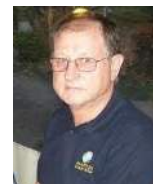
di Salvatore Seno