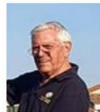
di Giuseppe Zambon

Sabato 21 marzo , nella splendida cornice dell'Alpe Cimbra, a Folgaria , si è svolta la XXVII edizione del Panathlon Sci, il Campionato Italiano di Sci Alpino riservato ai soci Panathlon, ai loro familiari e loro amici.